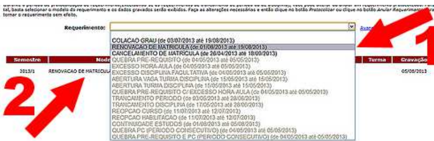
Figura 6: Tela parcial da área de Protocolização de requerimentos do site Minha UFOP .

Na próxima tela, Protocolização de Requerimentos , no campo Requerimentos (destaque 1 na figura 6), você deverá escolher Renovação de matrícula . Após essa seleção, o item Renovação de Matrícula aparecerá na tabela, conforme indicado no destaque 2, na figura 6.