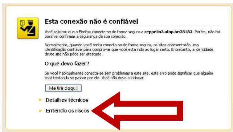
Figura 1: Tela de configuração do protocolo de segurança.

Na próxima tela, clique no botão Adicionar exceção... , conforme indicado na figura 2.