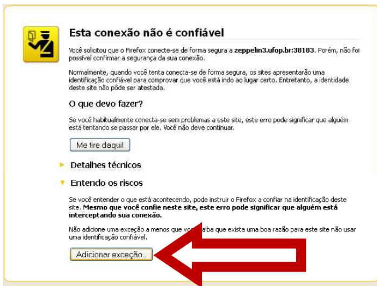
Figura 2: Segunda tela de configuração do protocolo de segurança.

Na próxima tela, clique no botão Adicionar exceção... , conforme indicado na figura 2.